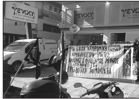
Επάνω: Παρέμβαση στη Γενική για τον ξυλοδαρμό συναδέλφου στη Γενική Γλυκών Νερών (28/01/21)

Τα πραγματικά διαμαντάκια, λοιπόν, κρύβονται πίσω από το φανταχτερό περιτύλιγμα των καλών ειδήσεων. Σε αυτή την εποχή, είναι ακόμη πιο απαραίτητο να τραβάς την κουρτίνα για να ρίξεις μια ματιά από πίσω, εκεί που γίνεται το παιχνίδι. Αλλιώς, πέραν του ότι δουλεύεις τζάμπα, ΤΖΑΜΠΑ ΘΑ ΧΑΙΡΕΣΑΙ. Εκτός αν πιστεύεις ακόμη στα παραμύθια!